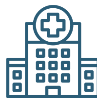
CENTRES SOCIALS I SANITARIS