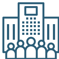
BOTIGUES I CENTRES DE TREBALL