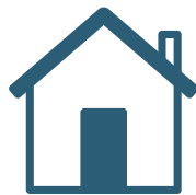
LLARS I COMUNITATS DE VEÏNES I VEÏNS