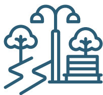
PLACES I CARRERS